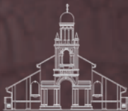
鸟节路聚会 Orchard Road Congregation