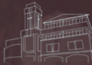
武吉巴督聚会 Bukit Batok Congregation